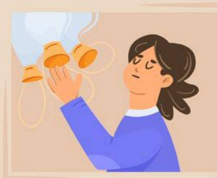
take the mask immediately