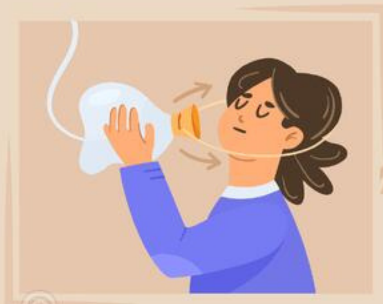
locate mask on your face