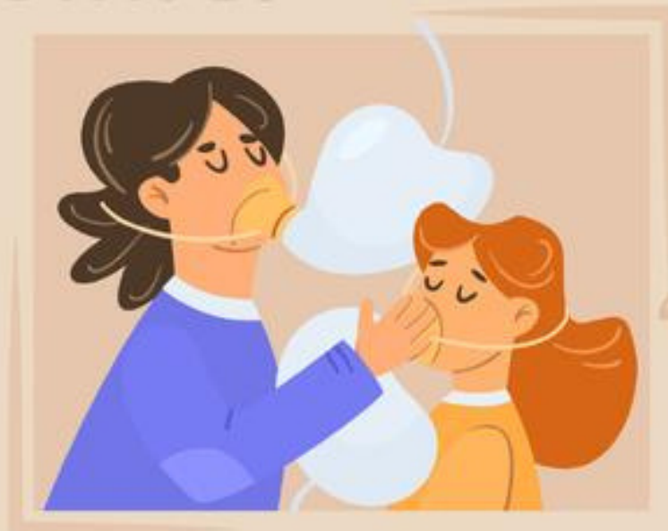
put on an oxygen mask on the baby