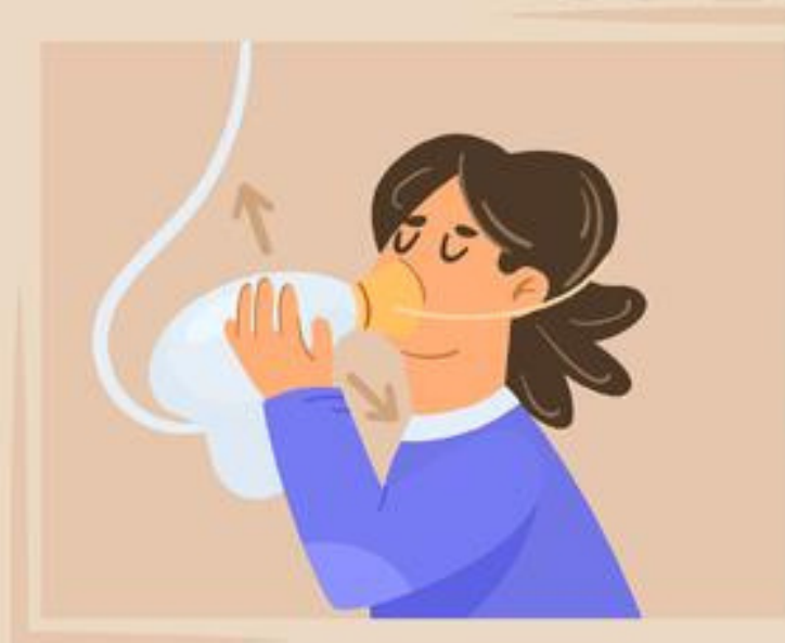
pull the ropes to supply oxygen